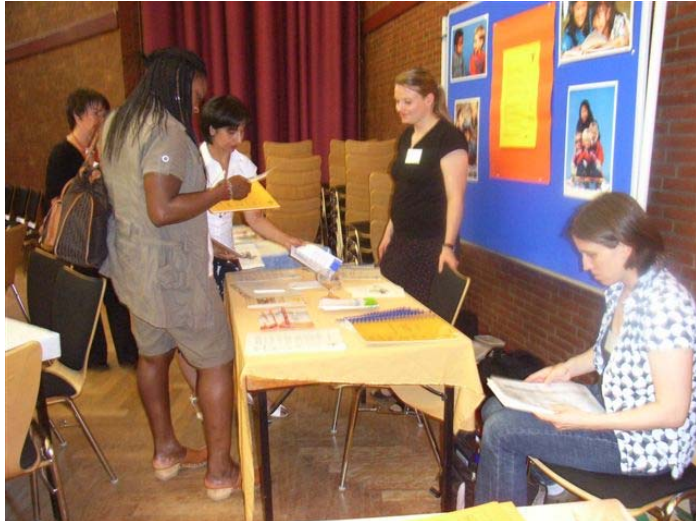
Informationsstand des Hamburger Fachkreises „Sexualisierte Gewalt in der Einwanderungsgesellschaft“