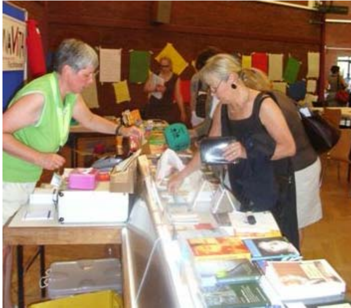
Infostand des pädagogisch therapeutischen Fachhandels Donna Vita