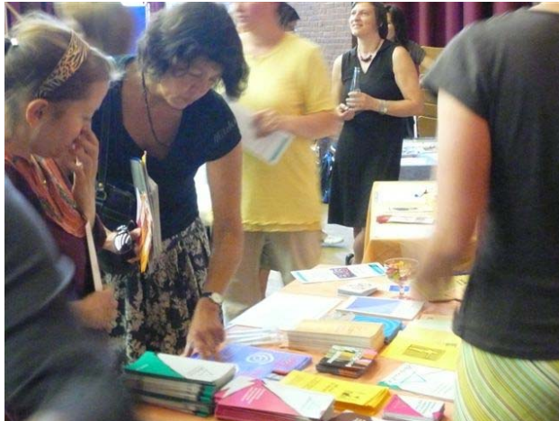
Infostand von Nexus – Netzwerk Hamburger Fachberatungsstellen gegen sexualisierte Gewalt an Mädchen und Jungen